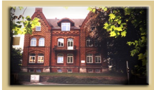
Sitz des Vorstandes in Suhl

Am 14. September 1991 erfolgte in Suhl die Neugründung als Verein. In all den Jahren des Hineinwachsendens in die neue Gesellschaft gab es viele Fragen auf fast allen gesellschaftlichen Gebieten, die nach Beantwortung suchten. Der Suhler URANIA-Bildungsverein konnte hierzu auf die seit 1888 vom „Verein zur Verbreitung wissenschaftlicher Kenntnisse“ entwickelte Tradition zurückgreifen und Erkenntnisse aus Wissenschaft, Technik und Gesellschaft breiten Bevölkerungsschichten zugänglich machen.