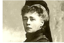
B. v. Suttner